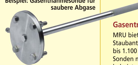
VA-Sonde bis 900 °C mit Flansch DN 65 PN 6 mit Sintermetall Vorfilter 3 µ