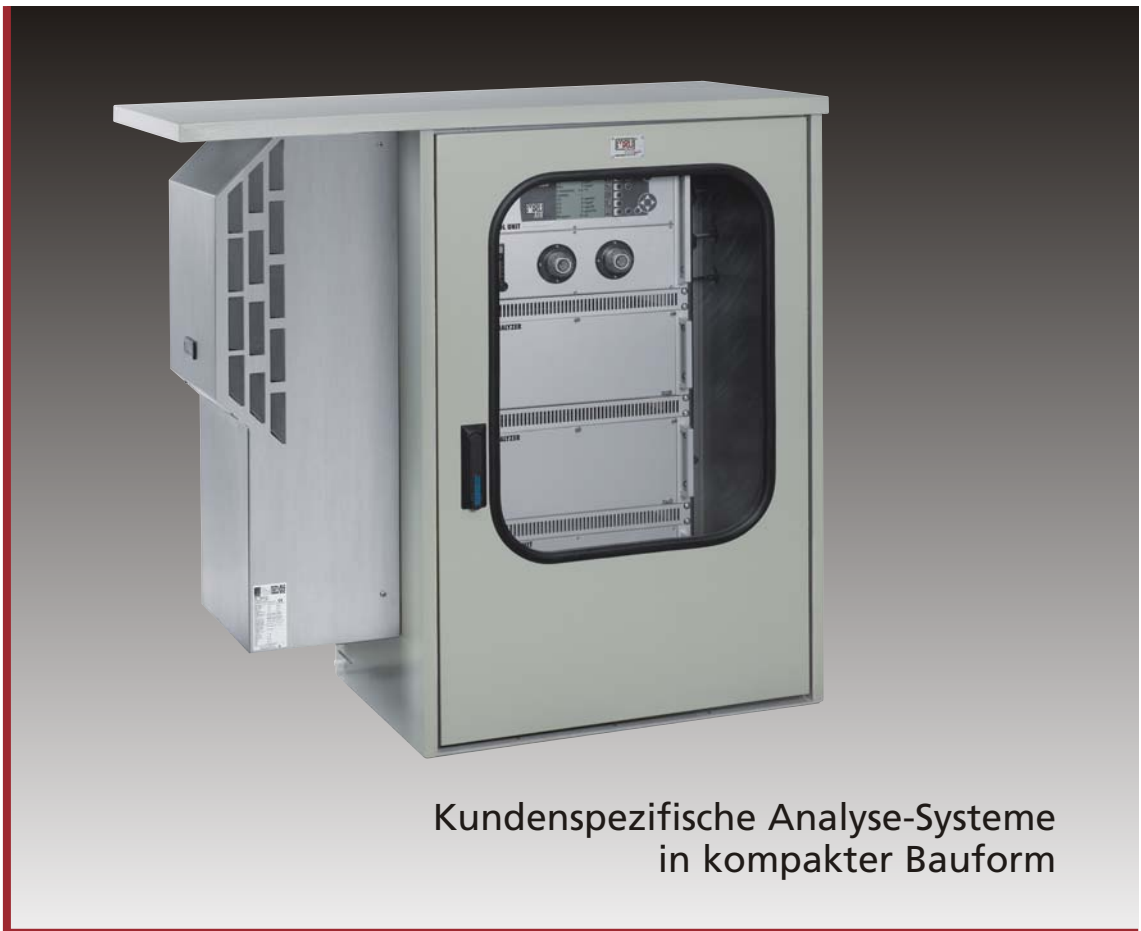
Kundenspezifische Analyse-Systeme in kompakter Bauform